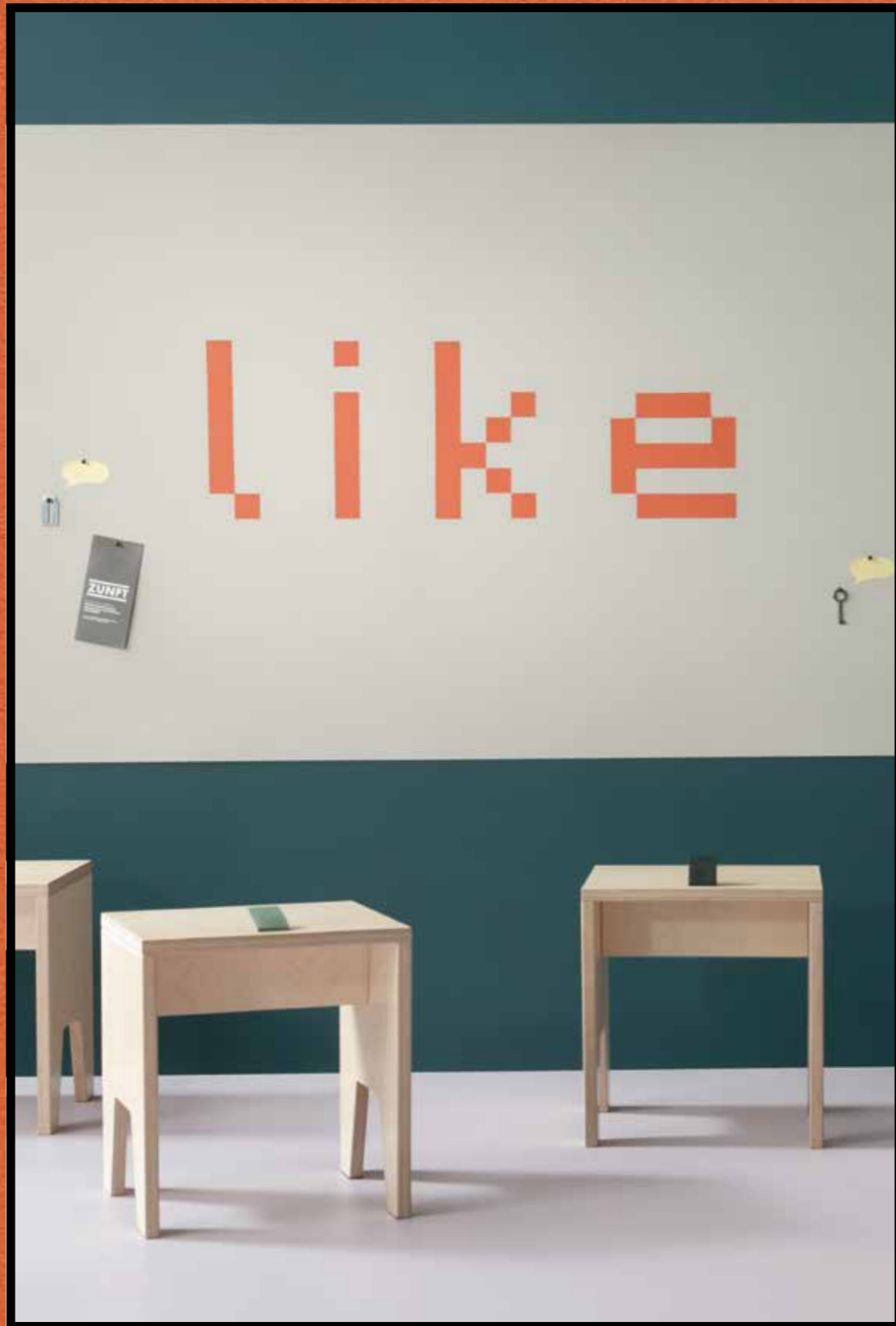
2206 | oyster shell 2211 | tangerine zest 3363 | walton lilac