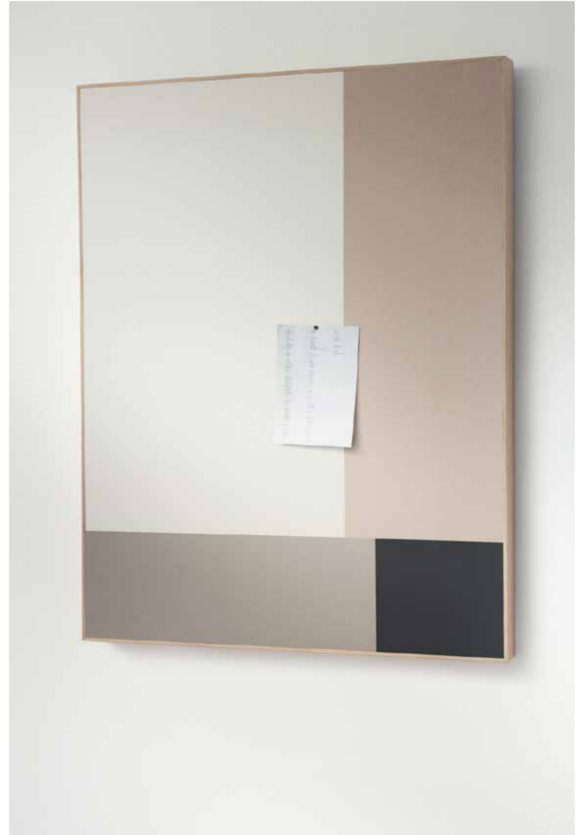
2182 | potato skin 2187 | brown rice 2206 | oyster shell 2209 | black olive

Der Kreativität sind keine Grenzen gesetzt. Die Oberflächen können nach eigenen Wünschen und Farbvorstellungen gestaltet werden – Uni oder in Kombination mit unterschiedlichen Nuancen.