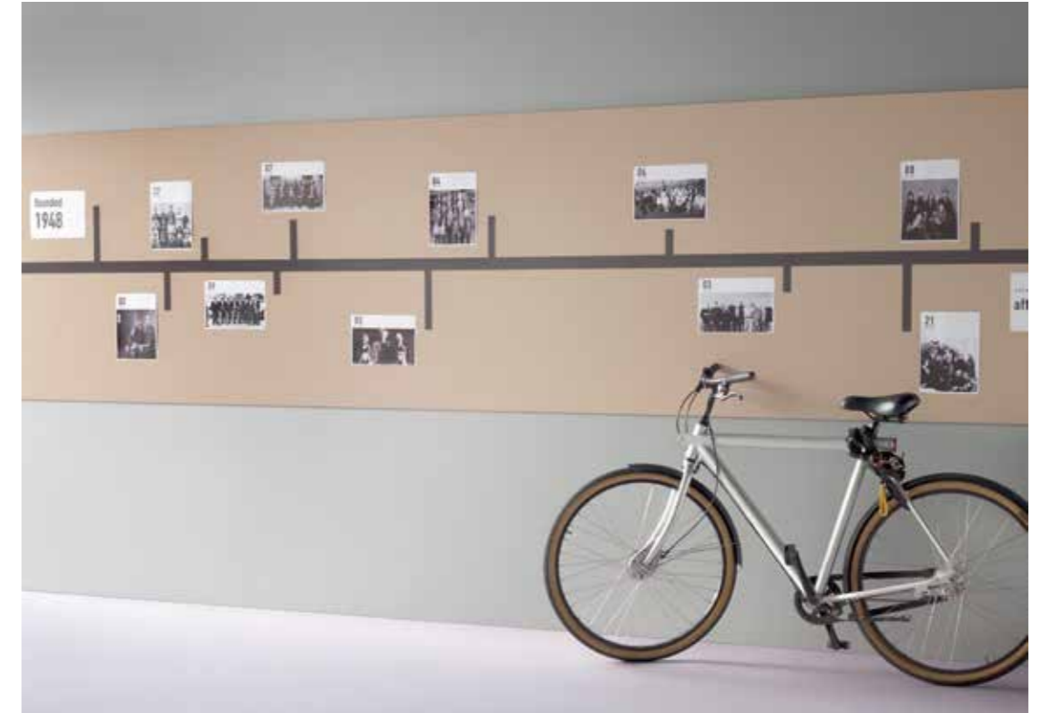
2186 | blanded almond 3363 | walton lilac