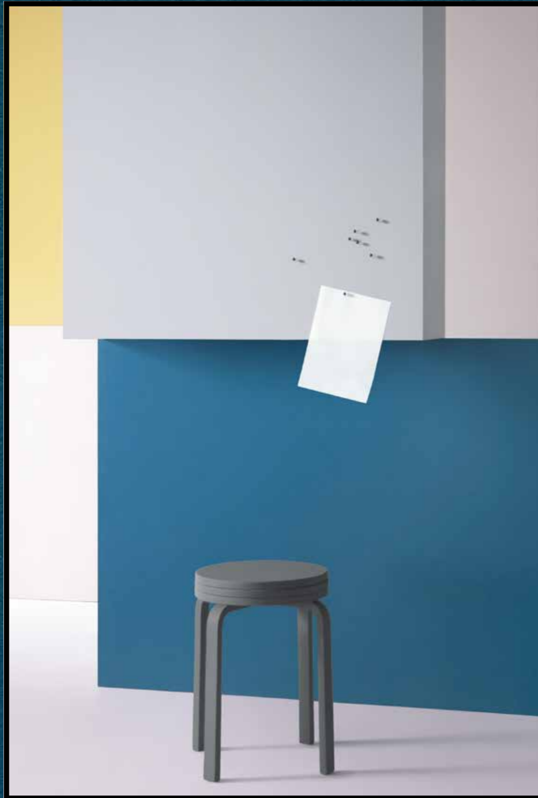
2162 | duck egg 2186 | blanded almond 2214 | blue berry 3363 | walton lilac