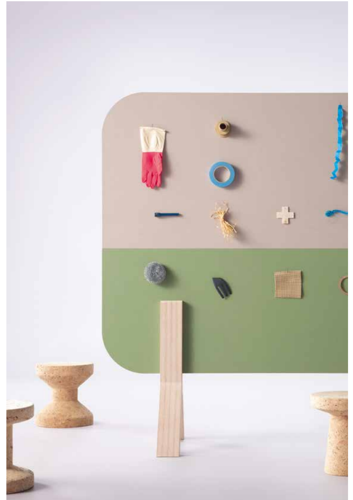
2187 | brown rice 2213 | baby lettuce 3363 | walton lilac

BULLETIN BOARD bietet ideale Lösungen für moderne und nachhaltige Umgebungen. Als Raumteiler eingesetzt, trägt es in Großraumbüros zu effizienter Kommunikation bei.