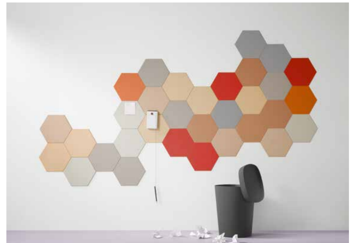
2210, 2207, 2166, 2162, 2206, 2182, 2187, 2186, 3363 | walton lilac

BULLETIN BOARD ist ein dekoratives sowie funktionelles Oberflächenmaterial. Es ist flexibel einsetzbar und einfach zu verarbeiten. BULLETIN BOARD ist erste Wahl, wenn Wert auf eine funktionelle Wandverkleidung gelegt wird.