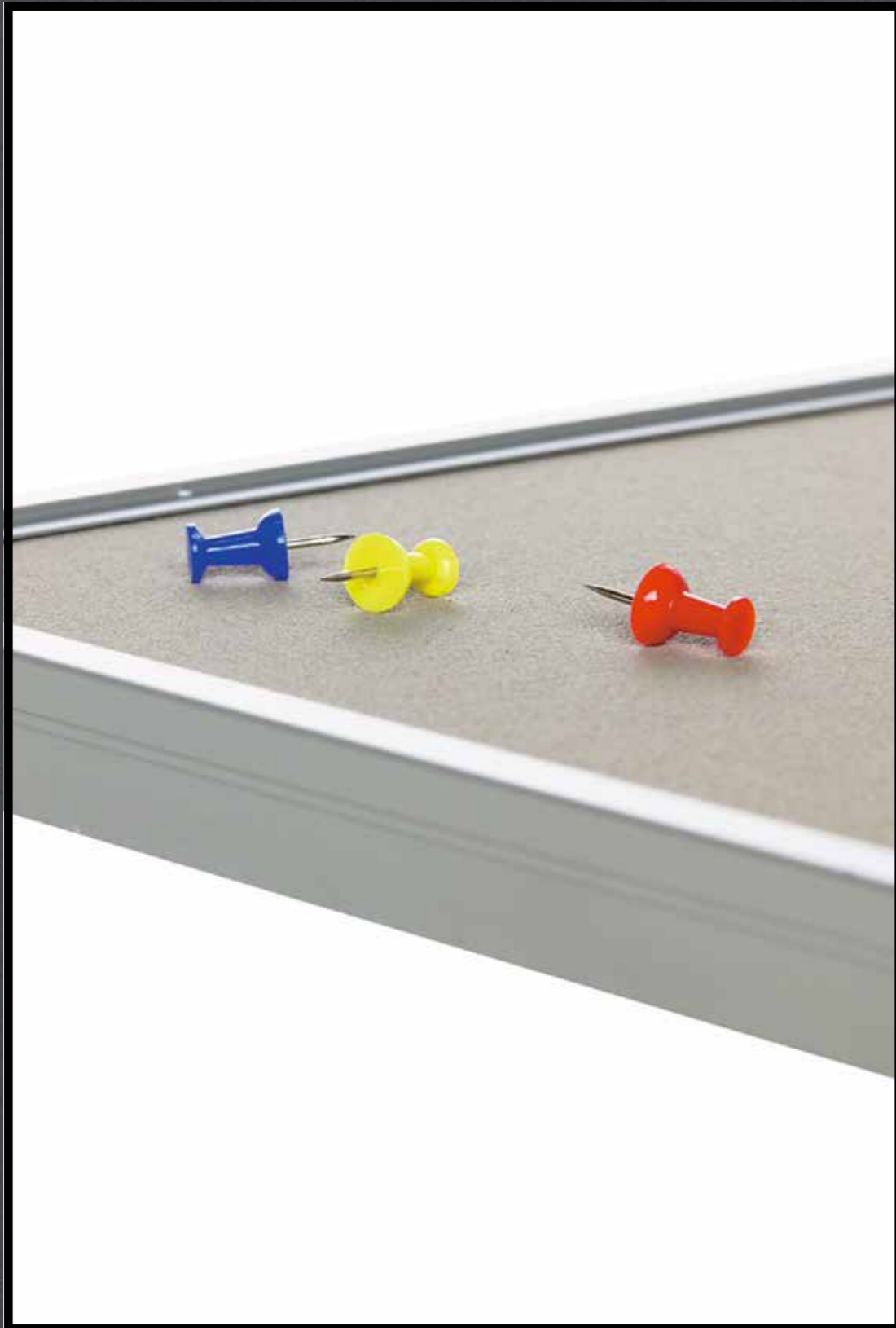
2187 | brown rice