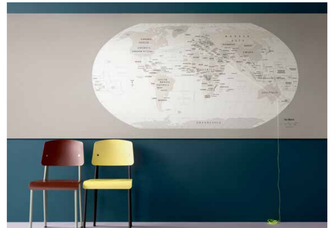
2182 | potato skin 3363 | walton lilac

BULLETIN BOARD ist in ca. 28 m langen und 1,22 m breiten Rollen lieferbar. Dies erleichtert z.B. die Montage in Konferenzräumen oder die längsseitige Anbringung in Fluren. BULLETIN BOARD est fourni en rouleau, jusqu'à 28 m de long et 1,22 m de large, approprié pour une pose dans des grands espaces* tels que les salles de conférences ou le long d'un couloir.