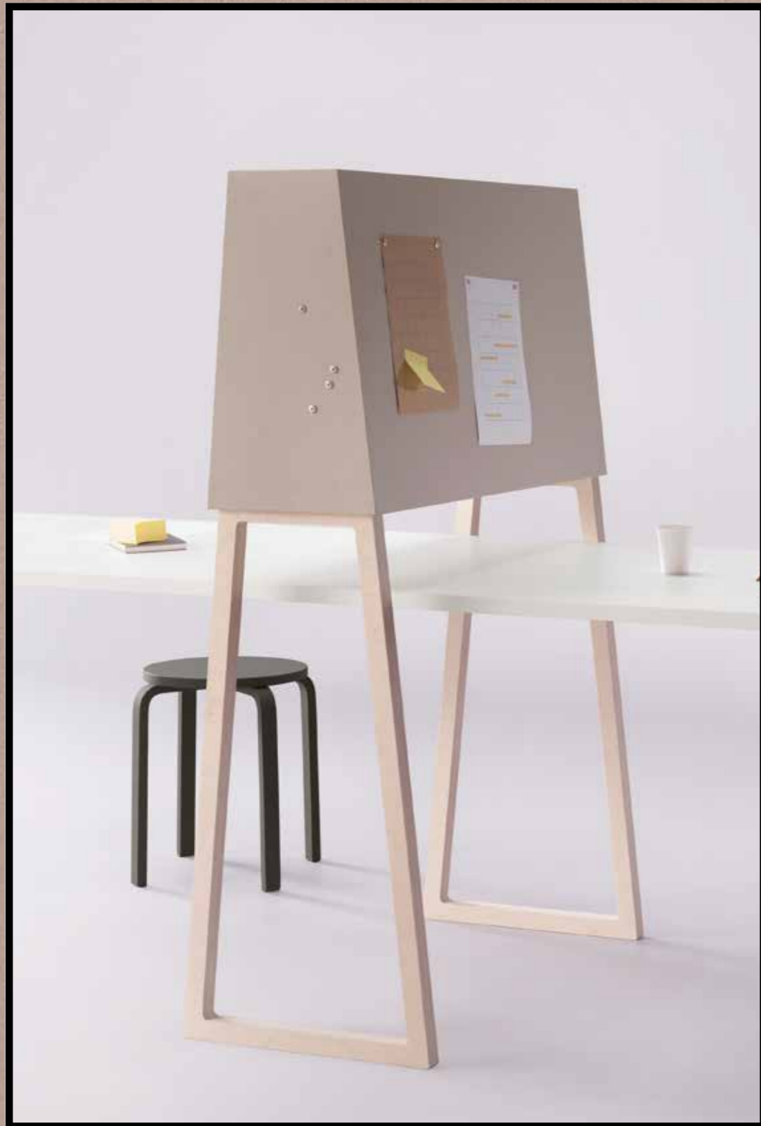
2187 | brown rice 3363 | walton lilac